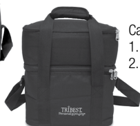
Carrying Cases 1. Black (#PB10BL) 2. Black Deluxe (#PB10BD)