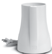
Motor Base (#PB01)

(Please call 888-254-7336 or visit www.tribestlife.com for availability and pricing)