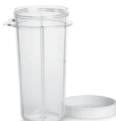
16oz. BPA-Free Blending Cup with Lid (#PB02BF)