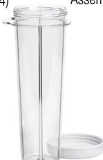
23oz. BPA-Free XL Cup with Lid (#PB02BF)